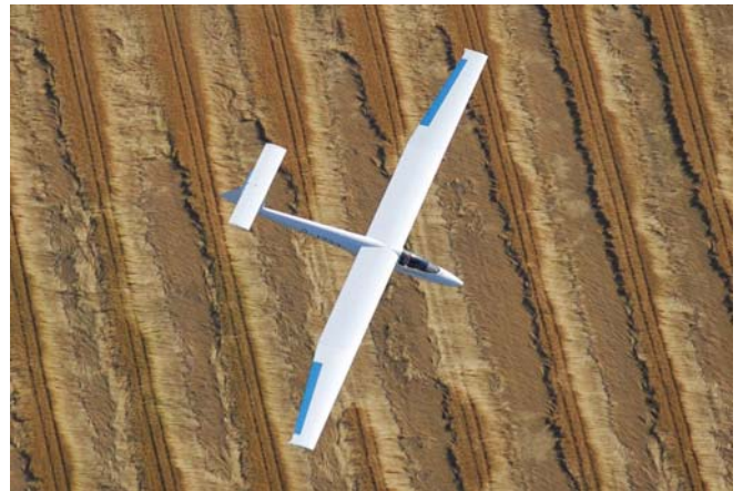
Pirat D-1733, Pilot vermutlich Ulrich Pommer (nach Recherche im Hauptflugbuch)

Am gleichen Tag entstand bei einem Flug mit kräftiger Thermik (Steigen 3 m/s) dieses Foto :