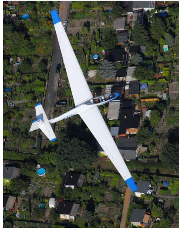
Bocian D-7362 über dem Dessauer Obstmusterergarten